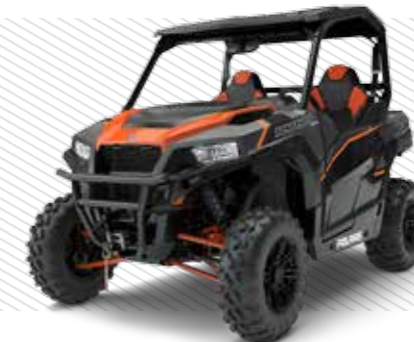
Titanium Matte Metallic