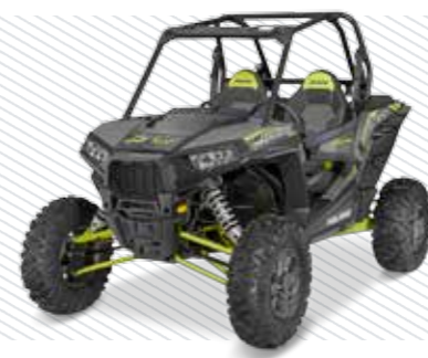
Titanium Matte Metallic Z17VDE9NM