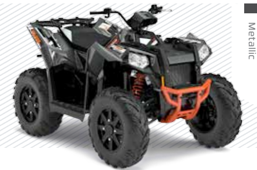
Titanium Matte Metallic