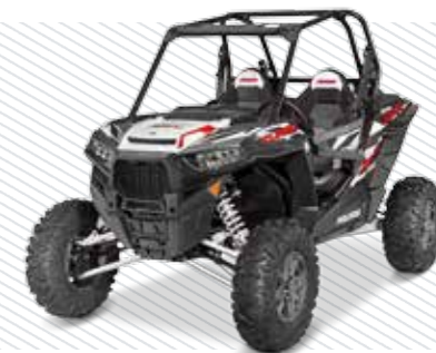
Cruiser Black Titanium Matte Metallic