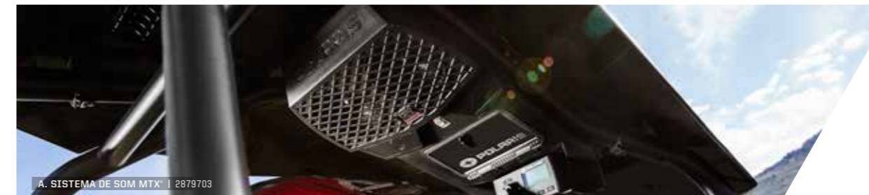
A. SISTEMA DE SOM MTX® | 2879703

Viaje com confiança e prepare-se para um incrível dia de off-road. Leve tudo o que necessita na caixa de carga traseira Lock & Ride e utilize o guincho para retirar qualquer obstáculo do caminho.