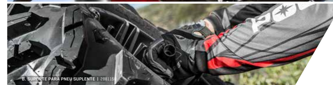
B. SUPORTE PARA PNEU SUPLENTE | 2881151